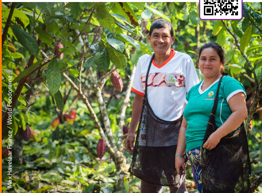
Max Havelaar France / World Foodorama