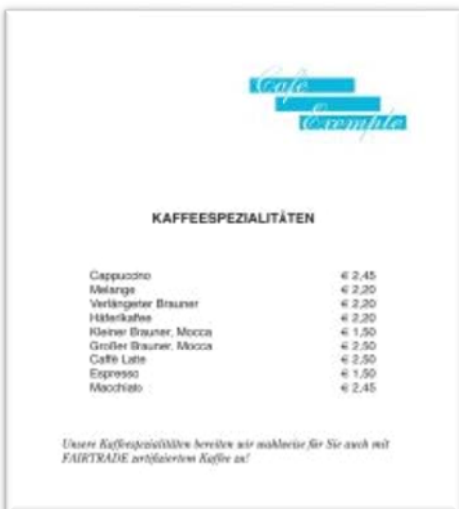
Abb.7 Beispiel FAIRTRADE auf Wunsch

Wenn Ihre Gäste zwischen FAIRTRADE zertifizierten und konventionellen Produkten auswählen können sollten Sie dieses Angebot auch bewerben. Auf keinen Fall darf dabei aber der Eindruck entstehen, dass alle Produkte FAIRTRADE zertifiziert sind: