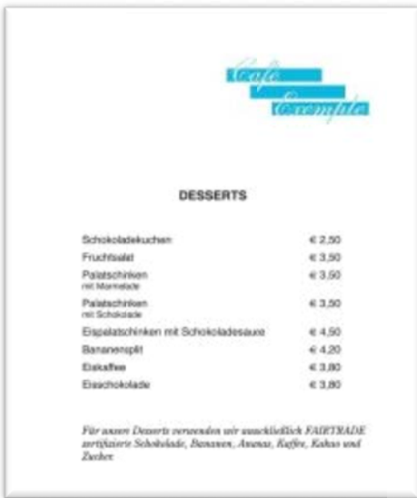
Abb.6 Beispiel Zutaten

Bei der Verwendung von FAIRTRADE zertifizierten Zutaten für Speisen und Getränke können Sie darauf besonders hinweisen: