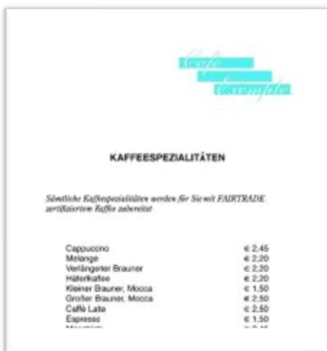
Abb.4 Beispiel Umstellung Produktgruppe

Wenn Sie eine komplette Produktgruppe auf FAIRTRADE umstellen, können Sie dies in Ihrer Karte ausloben: