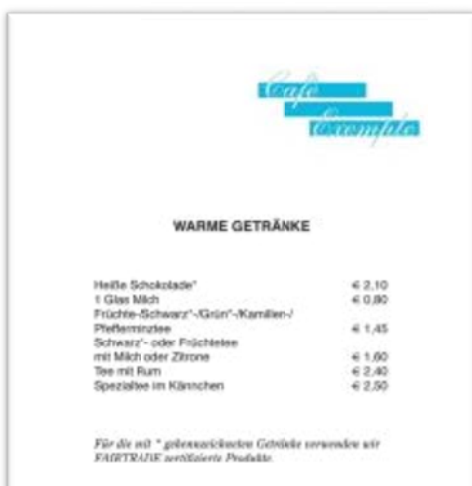
Abb.5 Beispiel Kennzeichnung bei konventionellen Produkten

Wenn auf Ihrer Karte sowohl konventionelle als auch FAIRTRADE zertifizierte Produkte angeboten werden, sind die Produkte mit FAIRTRADE-Siegel besonders zu kennzeichnen: