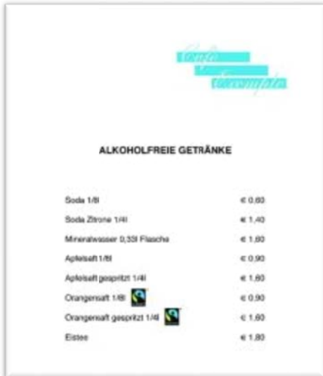
Abb.3 Beispiel Getränkekarte

Jene Getränke auf Ihrer Karte, die FAIRTRADE zertifiziert sind, können Sie mit dem FAIRTRADE-Siegel bewerben: