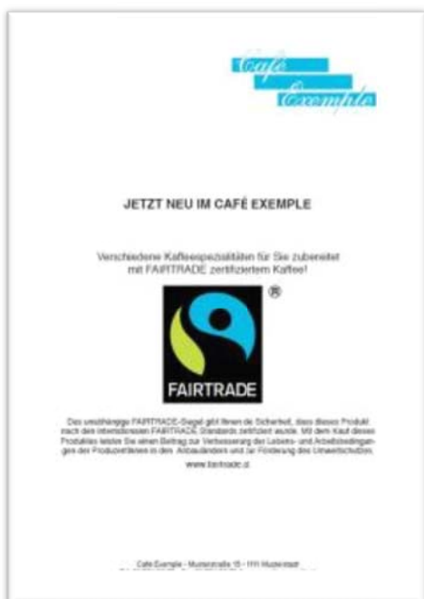
Abb.2 Beispiel Deklaration des Sortiments

Auf die Umstellung Ihres Betriebes können Sie auch besonders aufmerksam machen: