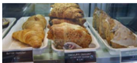
Abb.8 Beispiel Kärtchen